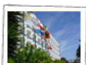
BAIA NORTE OTHON