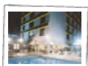
POUSADA VILA DOS

Ao todo, são 17 dias de folia, em que os blumenauenses se integram com visitantes do Brasil e do exterior. Além do chope e da cerveja, que são os principais atrativos da festa, a Oktoberfest tem objetivo de resgatar a origem alemã, com os desfiles, a participação dos clubes de caça e tiro e as apresentações dos grupos folclóricos.